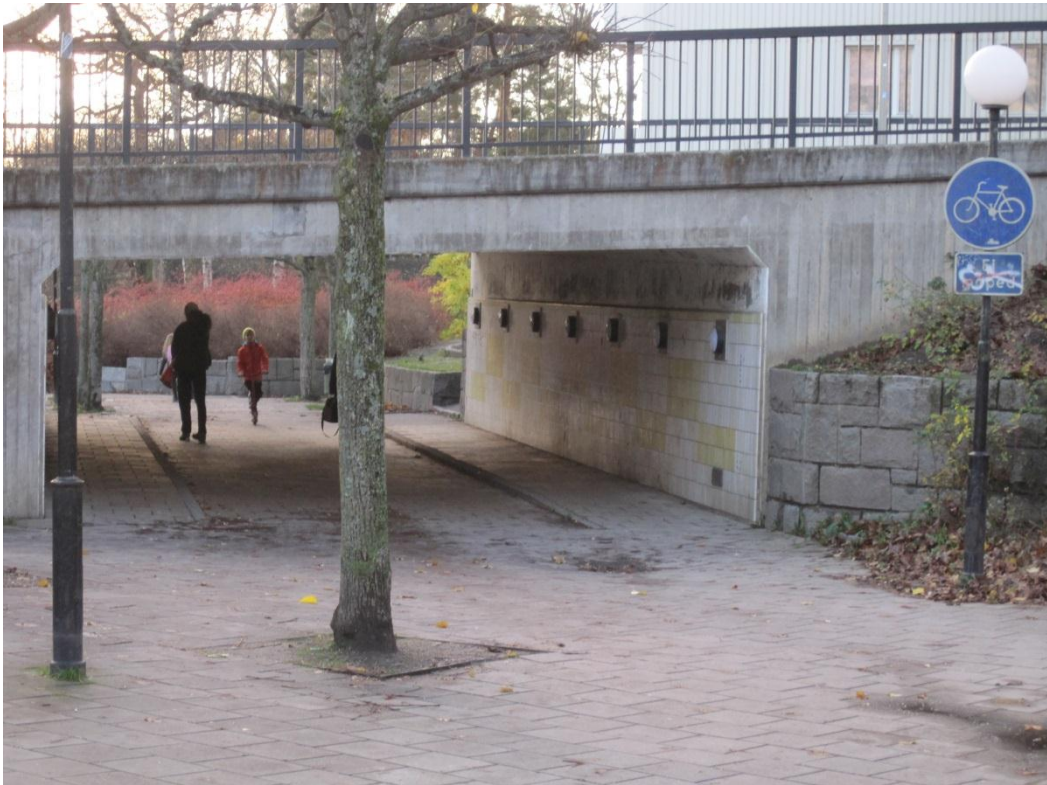
Tunneln under Önskehemsgatan upplevs otrygg eftersom missbrukare samlas här

Besökarna är positiva till utbudet av mataffärer i centrum och deras prisnivå samt till att det finns torghandel. Tillgången till bibliotek och dess verksamhet får mycket positiva omdömen. Tillgången till parkering i centrum lyfts också fram. Det uttrycks att det är fortfarande ett levande centrum med bank, post och apotek samtidigt som besökarna uttalar en besvikelse över att specialaffärer som järn – och färghandel och klädesbutiker försvunnit. Det är många som anser att orsaken till att många butiker lämnat beror på att hyrorna i centrum är för höga och att staden borde köpa tillbaks centrum och hålla en annan hyresnivå. Det är också många kommentarer om att de restauranger som har alkoholtillstånd inte sköter det. Detta bidrar till att det inte känns tryggt i centrum efter att butikerna stängt. Mängden missbrukare i centrum och att de både stör genom att vara högljudda och att de kissar i buskar och portgångar upplevs som ett stort problem. Vakterna som arbetar i centrum uppfattas både positivt och negativt. Det finns kommentarer om att de lyfter ut missbrukarna ur centrum, vilket leder till att de samlas på andra ställen som gångtunnlar och parker där det skapas nya problem. Det finns önskemål om att vakter och polis även bör arbeta i närområdet av centrum på gårdar och parker. Förskolan i parken Bandängen är särskilt utsatt.